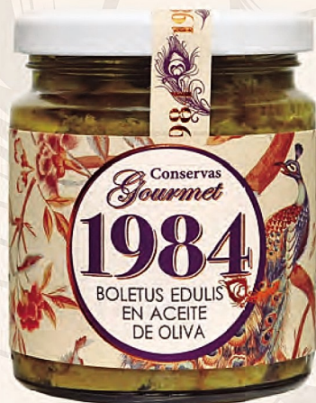
boletus edulis en aceite de oliva