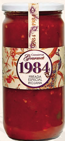
fritada especial riojana