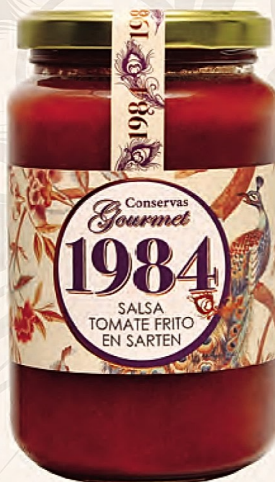
salsa tomate frito en sartén