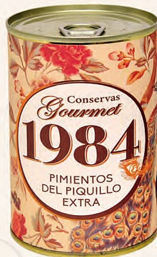
pimientos del piquillo extra 18/24 frutos