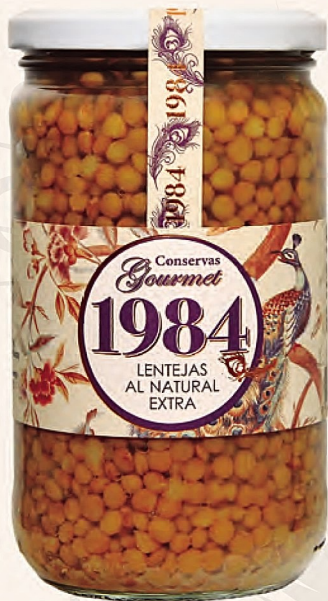
lentejas al natural extra