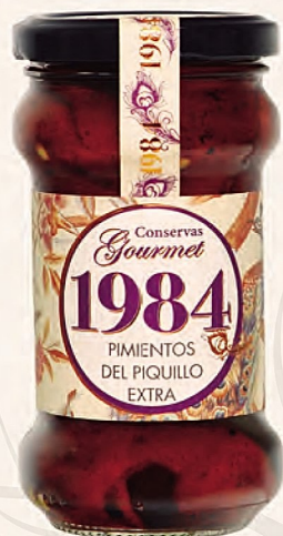
pimientos del piquillo extra 9/12 frutos