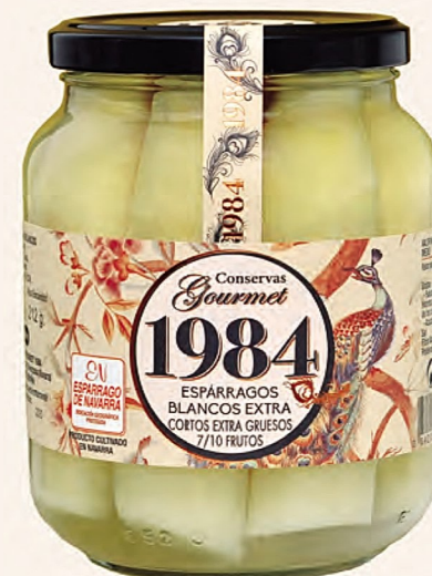
espárragos blancos extra cortos extra gruesos 7/10 frutos