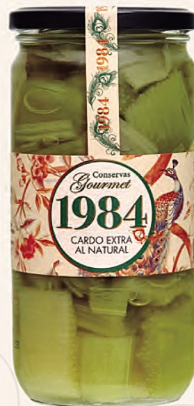
cardo extra al natural