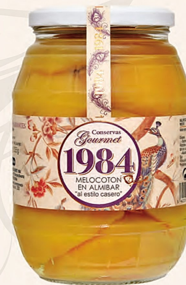
melocotón en almíbar "al estilo casero"