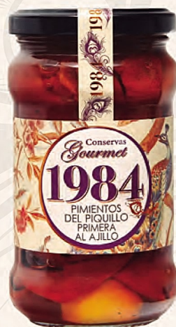
pimientos del piquillo primera al ajillo