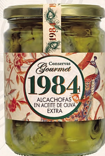
alcachofas en aceite de oliva extra