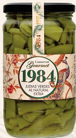
judias verdes al natural extra