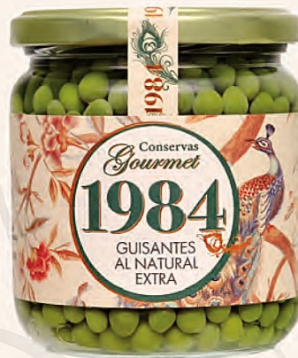
guisantes al natural extra