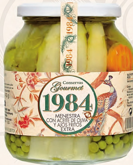
menestra en aceite de oliva con ajos fritos extra