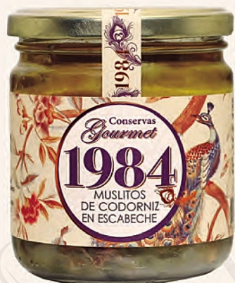
muslitos de codorniz en escabeche