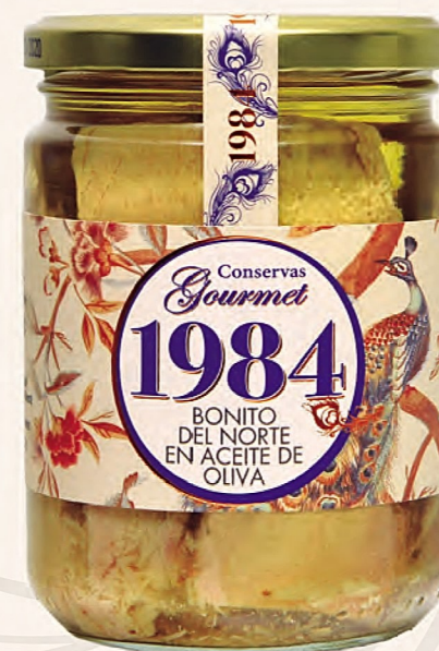
bonito del norte en aceite de oliva