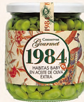
habitas baby en aceite de oliva extra