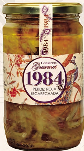
perdiz roja escabechada