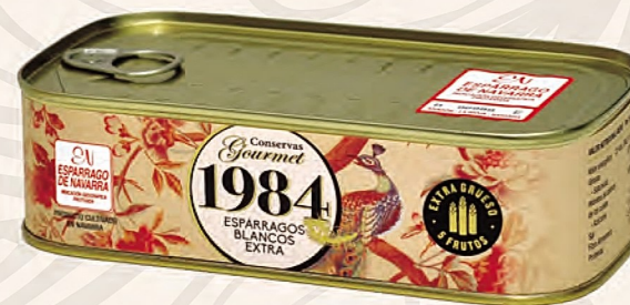
espárragos blancos extra