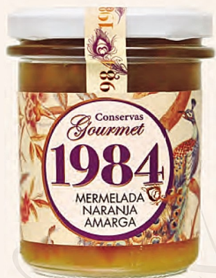
mermelada naranja amarga