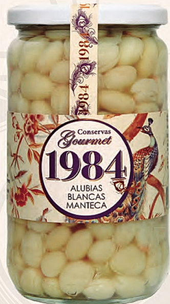
alubias blancas manteca