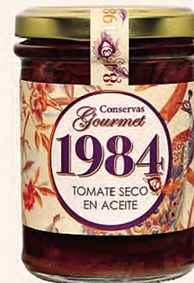
tomate seco en aceite