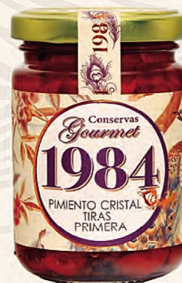
pimiento cristal tiras primera