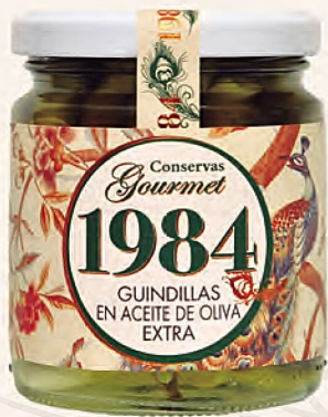
guindillas en aceite de oliva extra