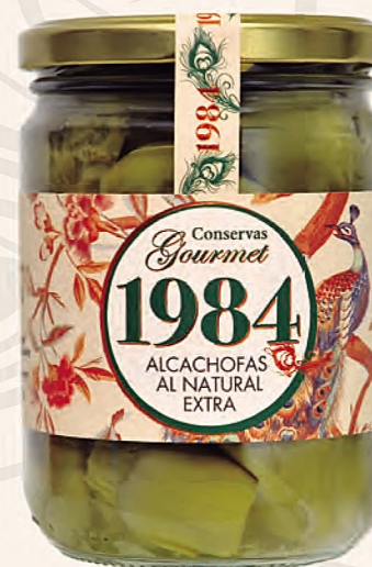
alcachofas al natural extra