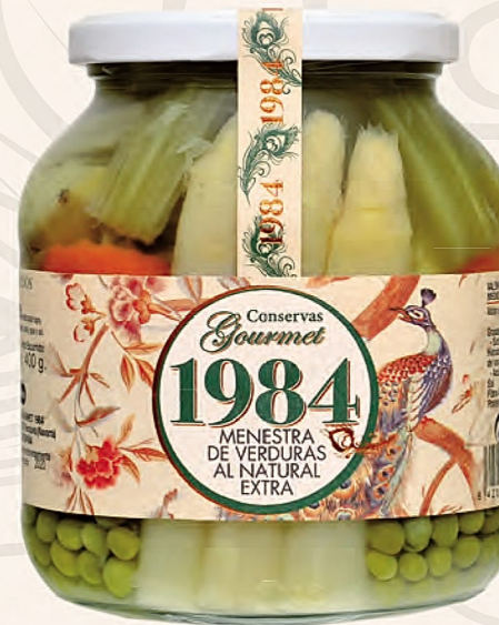
menestra de verduras al natural extra