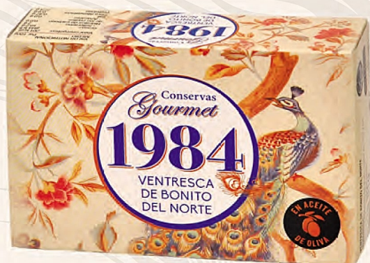
ventresca de bonito del norte