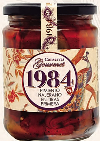
pimiento najerano en tiras primera