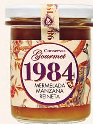
mermelada manzana reineta