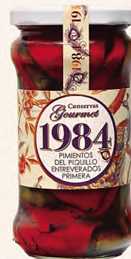
pimientos del piquillo entreverados primera