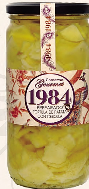
preparado de tortilla