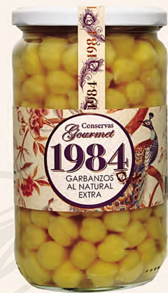
garbanzos al natural extra