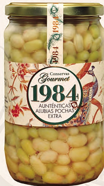
auténticas alubias pochas extra