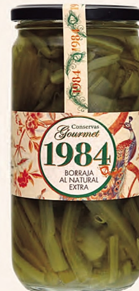
borraja al natural extra