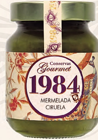
mermelada de ciruela