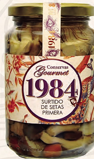
surtido de setas primera