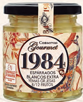
espárragos blancos extra yemas gruesas 8/12 frutos