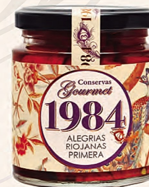
alegrías riojanas primera