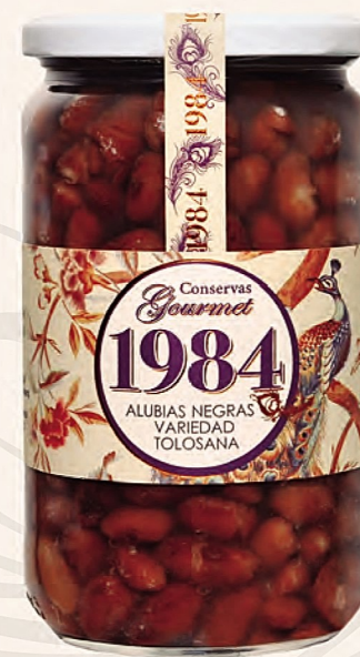
alubias negras variedad tolosana