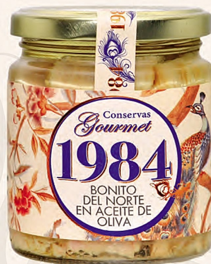
bonito del norte en aceite de oliva