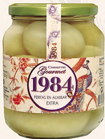
peritas en almíbar extra