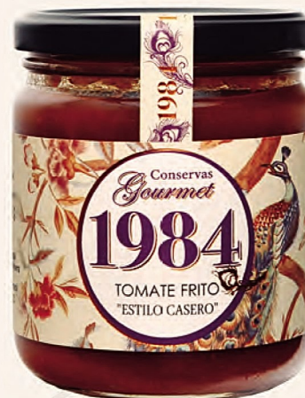
tomate frito "estilo casero"