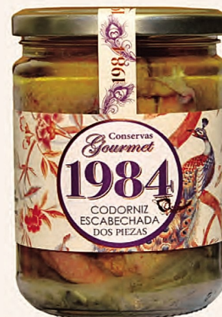
codorniz escabechada dos piezas