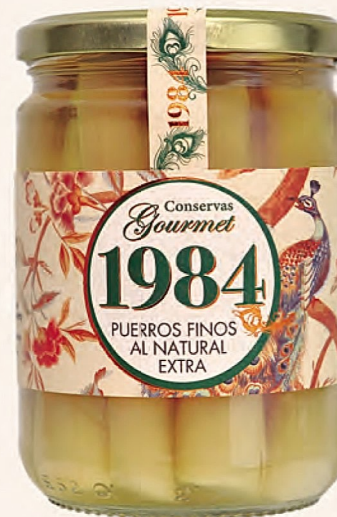
puerros finos al natural extra