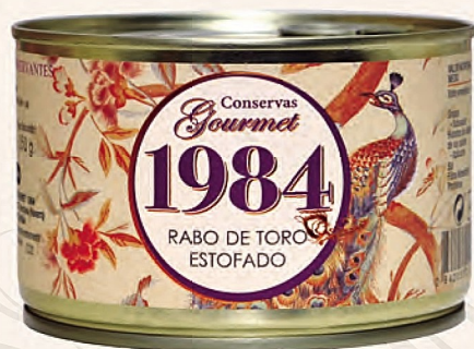
rabo de toro estofado