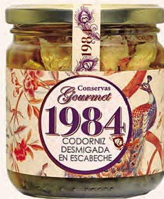
codorniz desmigada en escabeche