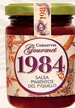
salsa pimientos del piquillo