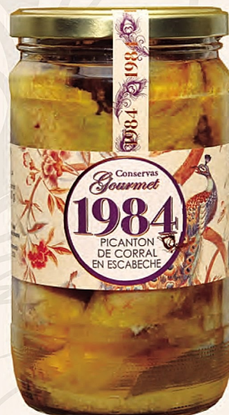
picantón de corral en escabeche