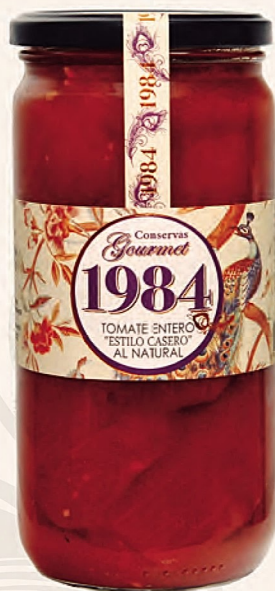
tomate entero "estilo casero" al natural