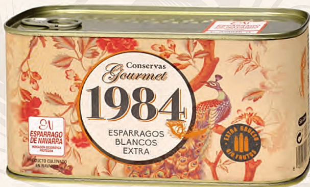
espárragos blancos extra