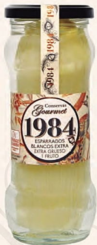
espárragos blancos extra extra grueso 1 fruto