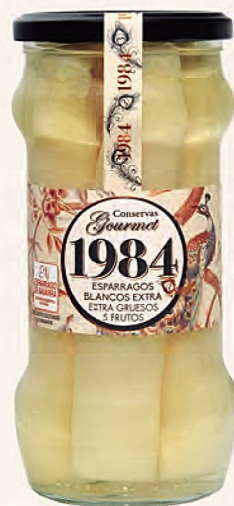
espárragos blancos extra extra gruesos 5 frutos